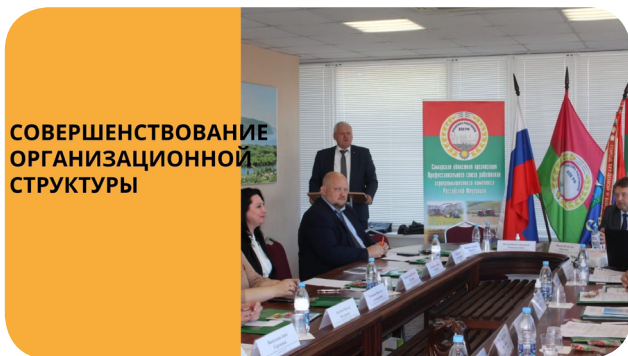
СОВЕРШЕНСТВОВАНИЕ ОРГАНИЗАЦИОННОЙ СТРУКТУРЫ

Хотелось бы, чтобы Центральный комитет имел возможность оказывать весомую финансовую и экспертную помощь территориальным организациям в работе по увеличению профсоюзного членства. Мы могли бы предложить запустить профсоюзные гранты на оргайзинг или предоставлять среднесрочные субсидии на возвратной основе. Но на это нужно собрать целевые средства. Многие из вас помнят, что на протяжении восьми лет на счете ЦК Профсоюза резервировались средства в размере 0,5% от собранных членских взносов, которые расходовались на солидарные действия и помощь профсоюзным организациям в критических ситуациях. Но эти средства закончились и в рамках существующей нормы отчислений в ЦК пополняться не могут. Предлагаю еще раз вернуться к вопросу о том, чтобы перечислять в ЦК 4% членских взносов, из которых 0,5% целевым образом